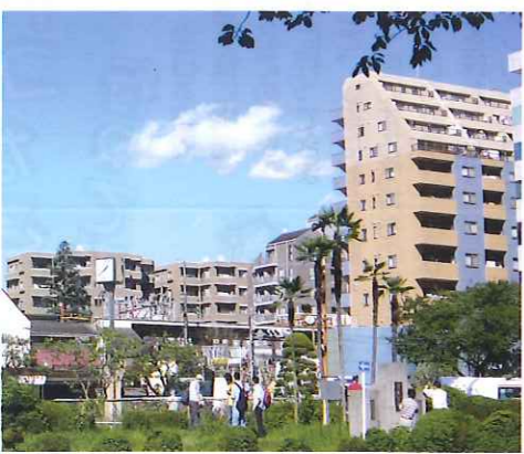
「管理の良さ」にあります。マン

マンション管理士としての私は、まだまだ微力ではありますが、分譲マンションという住まいが将来にわたって安心、安全な住まいであるように全力を傾注してお役に立ちたいと強く願っております。