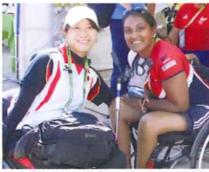
イギリスチームの友達。リオでの再会を約束しました。