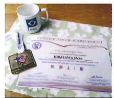
リオ出場権獲得の証書と金メダル。…と、ネットで衝動買いしたブラジル柄マグカップ。

日々の練習は もちろん、試合 もその生活の一 部。よほど特別 な大会でなければ 緊張もせず、 この時期にはこ の試合、と年中行事になつてい ます。ところが19年目にして初 めて、大失敗をしましてしまし た。4日後に控えた試合の準備 をしていてふと「申し込んだら け？」と不安になり、大会ホ ムページで出場者リストを見る と恐れていたことが。あちゃ、 申し込みしたつもりでしてなか たー！