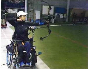
暗くなるまで練習中。

長年掛けて、実を結んだもの もありました。こちらは「飽き ずに」といふよりも、「諦めず に」やってきたおかげ。9月に 行われるリオ・パラリンピック の出場権を勝ち取ったのです。 アテネ以来、実に12年ぶりのパ ラリンピック。自分では、そん なに年月が経った実感はなく、 結果が出ずに「次こそは」「次 こそは!!」と、少しずつ進んで 来たら、よつやくたどりで着いた よつな、そんな感覚です。もち ろん、リオ出場がゴールではあ りません。リオの舞台で悔いの ない試合をし、メダルを首に下 げることが今の最大の目標。次 回、良い報告ができるよう、 また前に進んでいます。